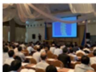
「職場における腰痛対策セミナー」