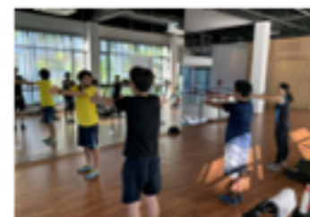
「生活習慣病予防の為の知識と実践」